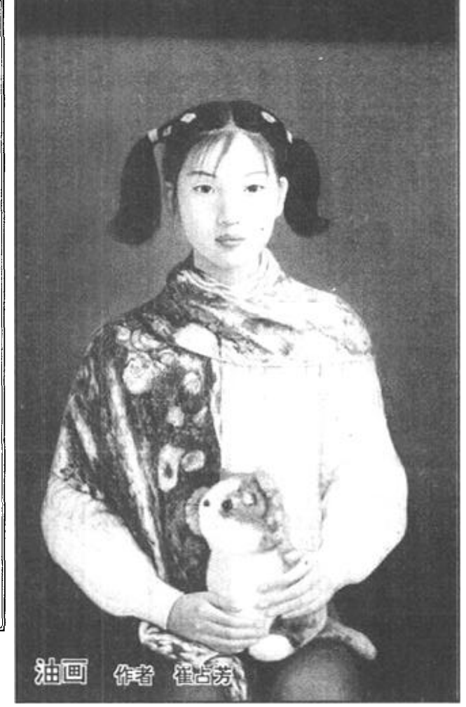
油画 作者 崔吉芳

在现实生活中，有一些人在物欲的诱惑下，却失去了理性与良知，不珍重甚至不要了人格。以致黄金升值，人格贬值。为官的，丢掉了官格；为文的，不要了文格；为公的，不顾了公德；为朋友的撕破了脸皮……有的人利令智昏，往往无端发问：“什么叫人格，人格多少钱一斤？”在这些人眼里，脸皮可以不要，名利不能不要，只要有钱，什么可以买，什么也可以卖。这种表现，当然只在一个人身上，其危害却不可低估。但愿传统道德和现代文明唤回他们的良知。 人格的力量是无价的，也是永存的。有人说，有钱能使鬼推磨。我说，有钱可以使鬼推磨，可它能使“仙”推磨吗？当然不能。“仙”是什么？“仙”有什么？不就是不为物欲所左右的崇高的人格吗？是的，在崇高的人格面前，一切都是那样渺小。仰望高山，比高山更高的是人格。